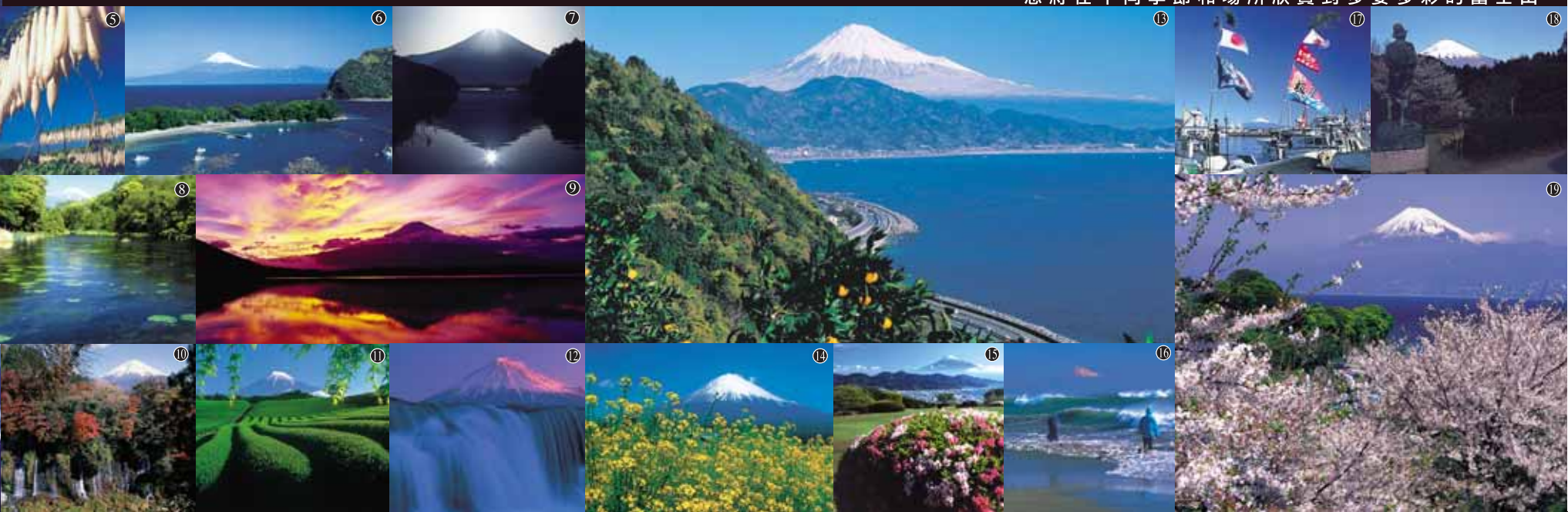
您將在不同季節和場所欣賞到多姿多彩的富士山。